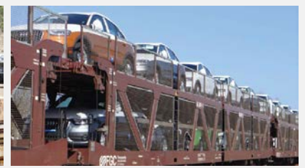
Vagó portacotxes articulat