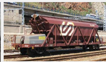
Vagó tremuja 62.000