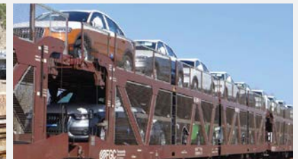
Vagó portacotxes articulat