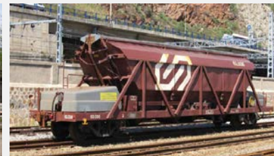
Vagó tremuja 62.000